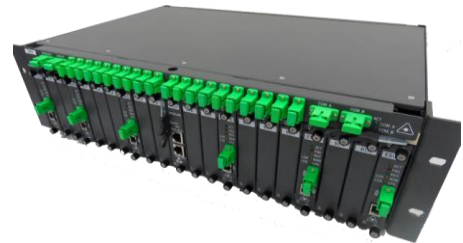
WDM-PON system based on PLC-ECL