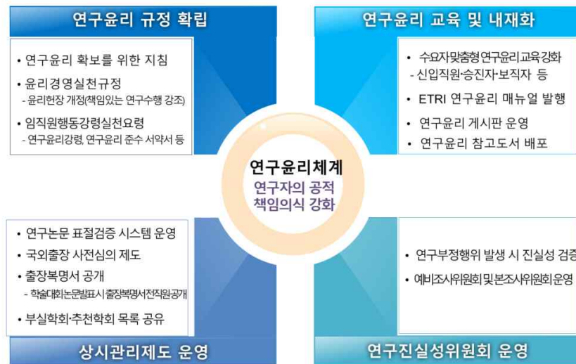
<그림> ETRI 연구윤리 관리체계도