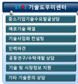
[1실 1기업 맞춤형 기술지원]