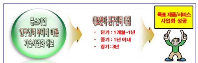
[중소기업 애로기술 해소를 위한 전문인력 지원 프로그램]

ETRI는 고급 전문 연구인력 확보 및 유지의 어려움으로 기술사업화에 애로를 겪고 있는 중소·중견기업을 지원하고자 ETRI의 풍부한 연구개발 경험을 축적하고 있는 우수한 연구인력을 기업이 필요로 하는 기간 동안 현장에 파견하고 있다. 기업은 자체 기술개발이나 기술사업화 애로 해소를 위한 R&D기획, 기술자문/지도, 기술개발, 사업컨설팅 등 필요로 하는 ICT기술분야 전반에 대하여 단기, 중기 및 장기 기간 동안 지원받을 수 있다.