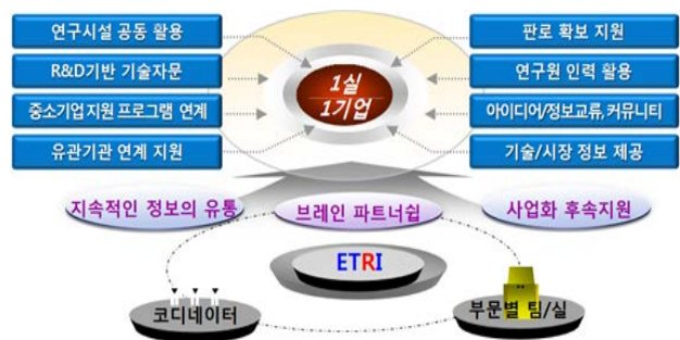
[1실 1기업 맞춤형 기술지원]

ETRI는 1연구실이 1기업에 대하여 맞춤형 기술지원을 하는 ‘1실 1기업 맞춤형 기술지원’ 체계를 운영하고 있다. 이는 각 연구실별로 성장잠재력이 우수한 중소기업을 파트너 기업으로 공개 선정하여, 잠재적 히트챔피언으로 성장할 수 있도록 기업을 지원하는 현지 밀착형 one-stop지원 프로그램이다. 선정된 기업은 ETRI 전문인력을 통하여 기업의 요구사항에 대한 기술자문, 정보제공, 기술지도, 장비 및 시설지원 등을 지원받게 된다. 기업부담금은 무료이며 선정 후 최대 2년까지 무상으로 밀착지원이 가능하다.