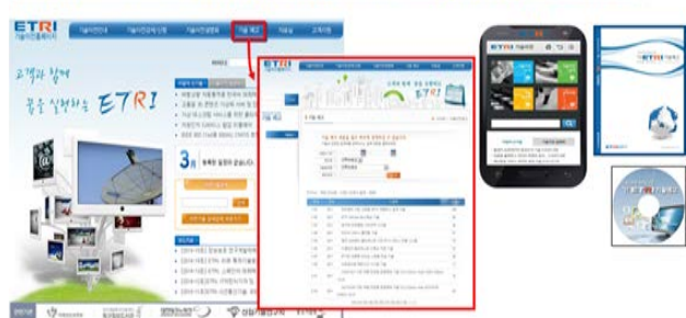
[기술예고 검색 화면]

http://www.etri.re.kr 의 기술예고 메뉴 또는 ETRI 기술이전 앱 접속 후 검색