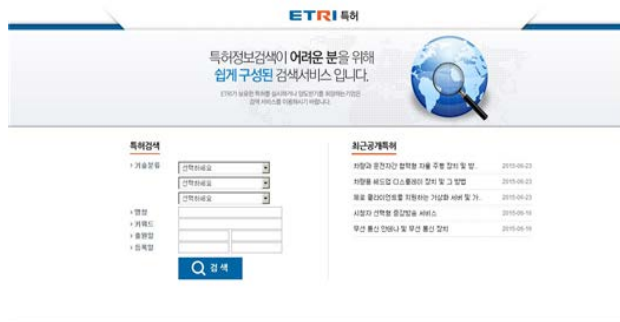
[ ETRI 홈페이지의 특허 메뉴 선택 및 검색 화면 ]

ETRI 홈페이지( http://www.etri.re.kr )에 접속 후, 특허 메뉴를 선택하여 검색할 수 있으며, 특허검색 사이트인 KIPRIS( http://www.kipris.or.kr )에서도 검색 및 확인이 가능하다. 특허무상양도는 무상양도 대상 특허 목록을 공고하고, 이에 대한 신청을 접수받아 심사 후 양수인을 선정하게 된다.