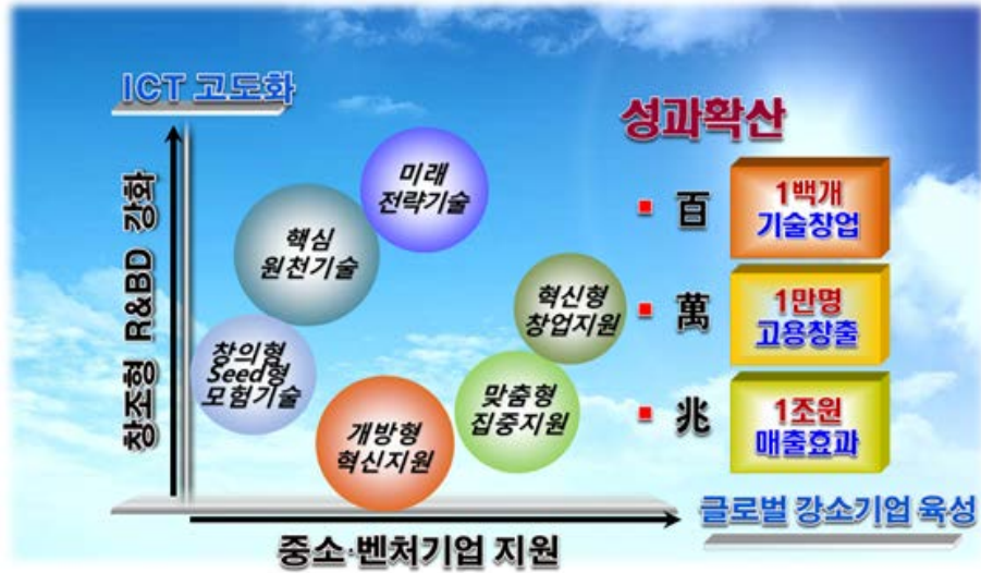
[ ETRI기업지원전략 ]

을 이루어 창조경제를 구현하고자 함이다. 특히, 기술개발 초기단계에서 부터 기술사업화, 기술창업 등에 이르기 까지 중소기업 육성과 일자리 창출로 연결될 수 있도록 기술이전 및 사업화지원 시스템의 고도화와 개선에 중점을 두고 있다.