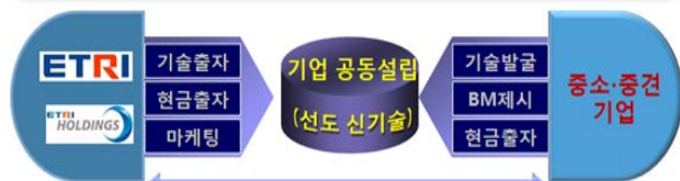
기술/경영 컨설팅을 통한 성장 지원 및 사업화 협력

연구소기업 : 특구 안의 국립연구기관 및 정부출연연구기관이 자신이 보유한 기술을 직접 사업화하기 위하여 자본금(기술, 현금 등)의 20% 이상을 출자하여 특구 안에 설립하는 기업(연구개발특구 육성 등에 관한 특별법)