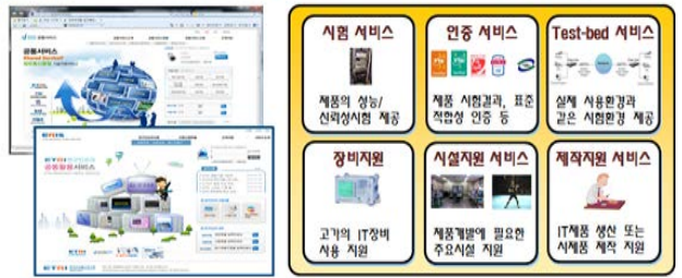
[시험 및 장비지원 서비스]

http://www.etri.re.kr 접속 후, 중소기업지원 메뉴 선택 및 검색 http://www.venture119.re.kr 또는 http://www.eris.re.kr 접속 후 검색